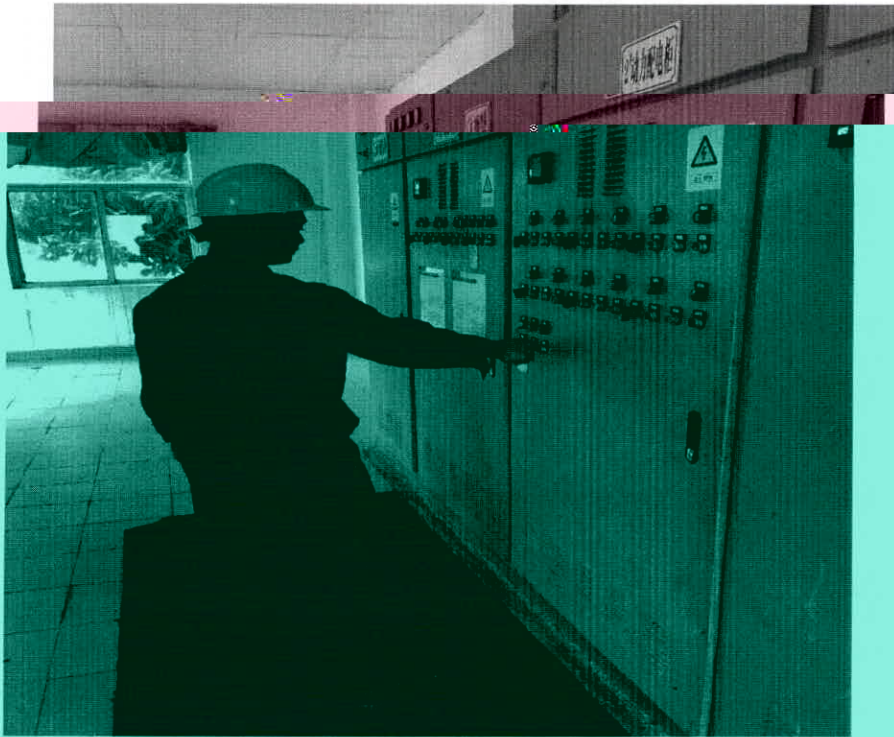
机修人员调整提升泵功率